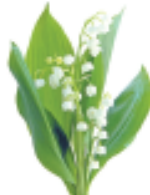
konwalia 10 maja