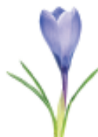
krokus 23 marca